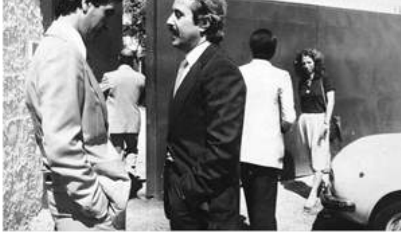
17 Giugno 1980 Sequestro del Bene. Giovanni Falcone davanti il cancello di Fondo Micciulla